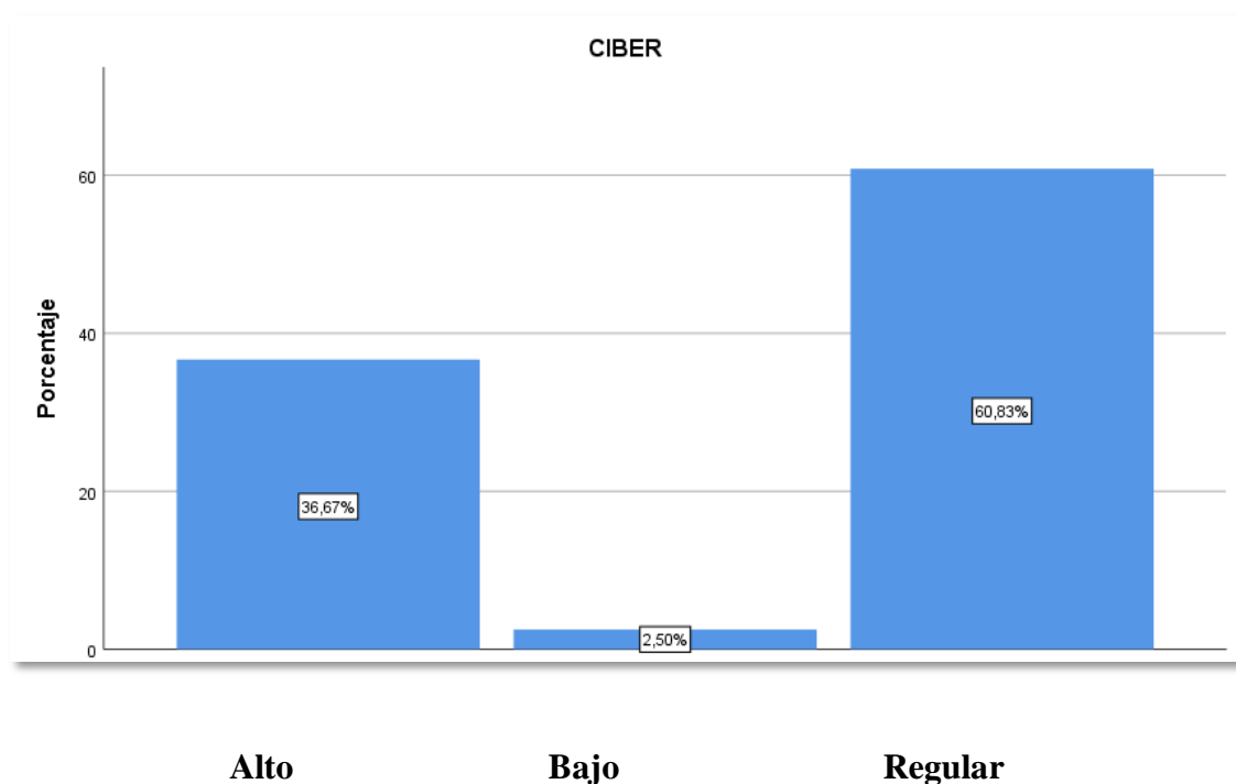
Tabla cruzada Tiktok - Agresor