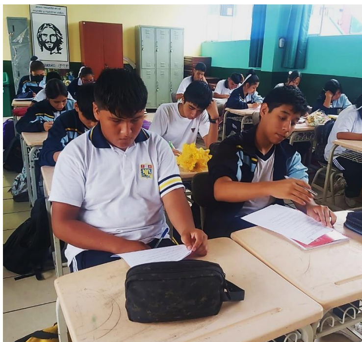
Estudiantes respondiendo el cuestionario.