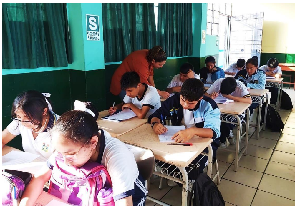
Segundo día de evaluación en la institución educativa “Nicolás Copérnico”.