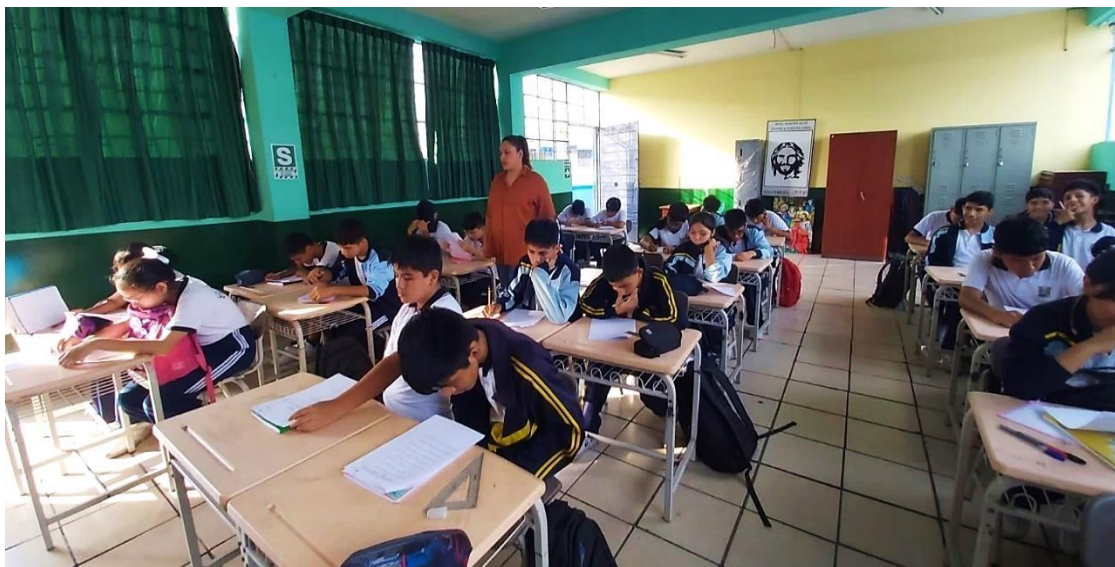
Estudiantes realizando la lectura previa para asegurar la comprensión de las preguntas.