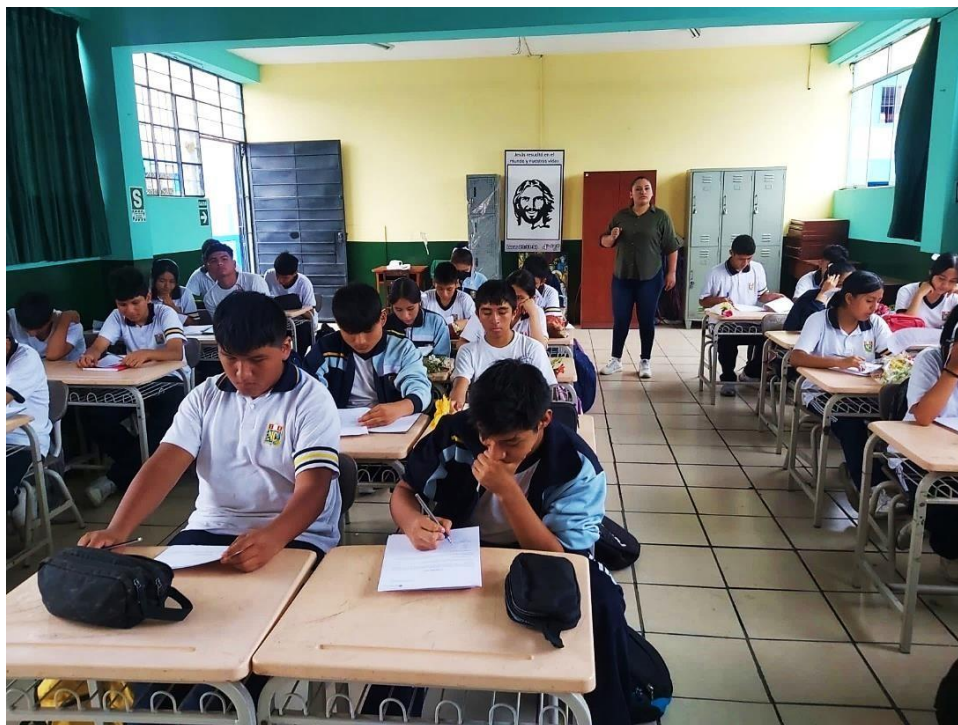
Primer día de evaluación en la institución educativa “Nicolás Copérnico”.