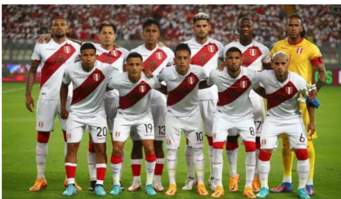
La Selección Peruana jugará el repechaje a Qatar 2022.

La Selección Peruana tendrá que pagar una importante multa debido al comportamiento de la hinchada en el duelo que sostuvo con Paraguay, por la última jornada de Eliminatorias.