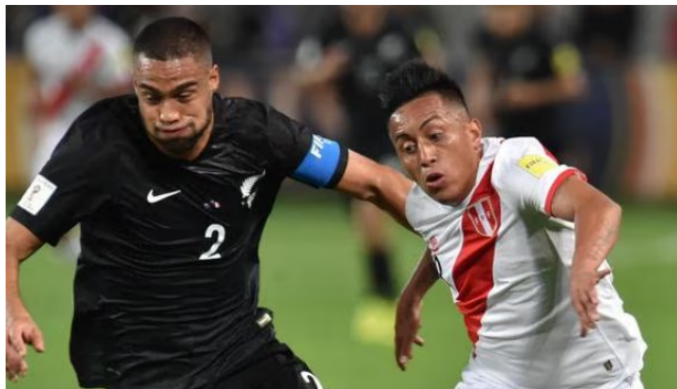
Perú jugará con Australia o Emiratos Árabes Unidos en el repechaje para llegar al Mundial.

La Federación Peruana de Fútbol hizo oficial que la blanquirroja se enfrentará al conjunto neozelandés en España. Además dio a conocer la fecha, hora y escenario del encuentro.