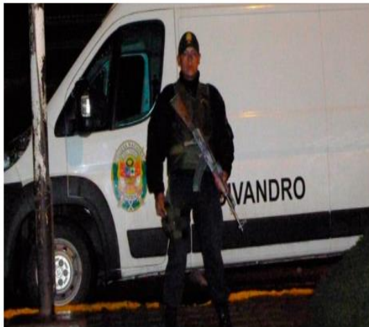
Sentenciado por robar droga de almacén.

Me gusta Compartir 501 Tweetear G+1 6 Enviar a un amigo