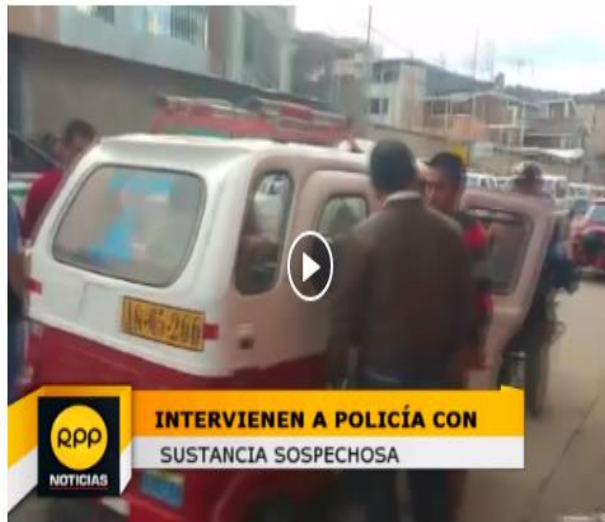
INTERVIENEN A POLICÍA CON SUSTANCIA SOSPECHOSA