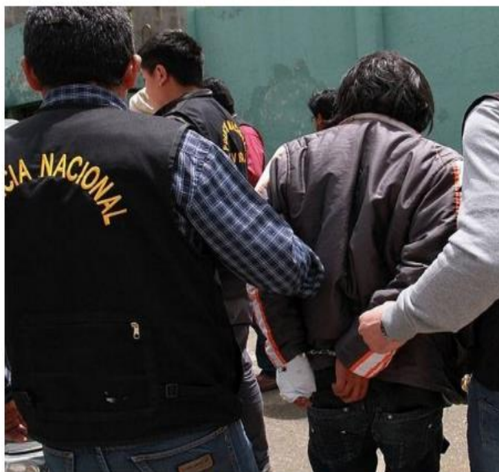
PUNO: detienen a policía involucrado en asalto a acopiadores de oro

La noche del último miércoles, aproximadamente a las 22:30 horas, un grupo de policías de la comisaría de Macusani llegó a la Región Policial y allí detuvieron a un efectivo que labora en esta institución.