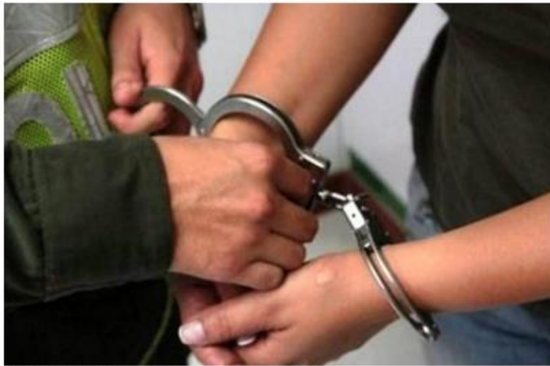
Dictan 25 años cárcel a PNP por captar menores para club nocturno

Su cómplice captó en Tarapoto a las dos menores bajo la promesa de ganar "una buena suma de dinero" a cambio de trabajar en el local nocturno