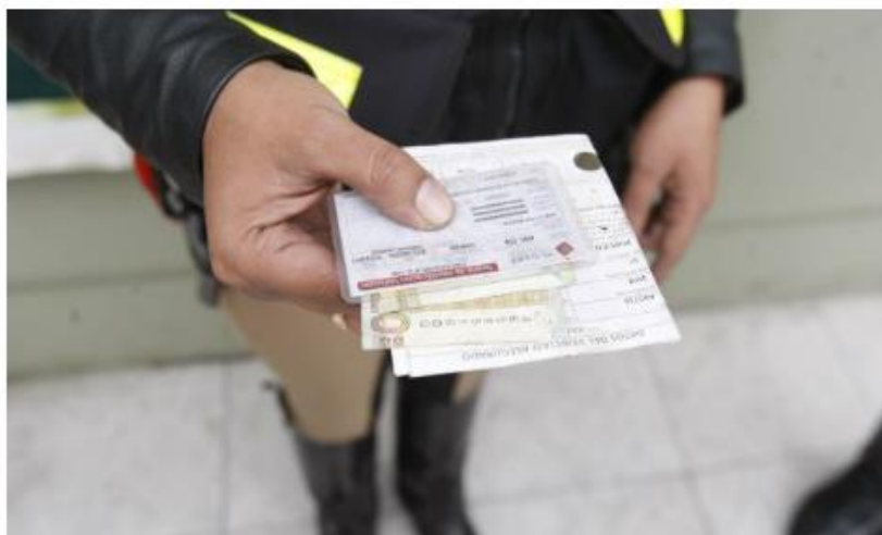
Malos policías laboraban en Juliaca. (USI)

Le pidieron dinero al propietario de un taxi que se accidentó.