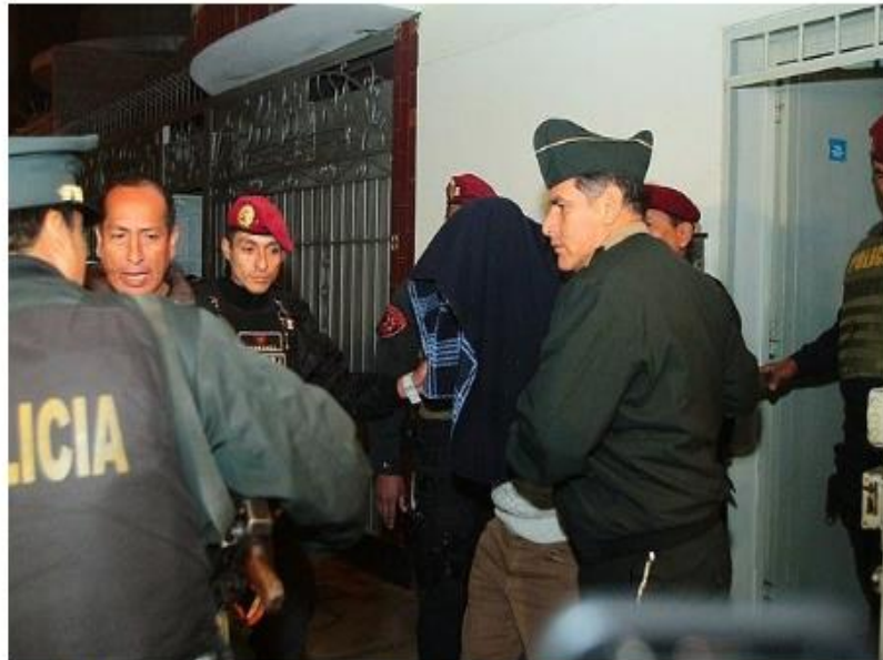
Policía balea a joven que practicaba deporte en parque de Los Olivos

Testigos del hecho indicaron que el efectivo de la PNP abrió fuego contra la víctima y sus amigos, debido a que supuestamente hacían mucho ruido y no lo dejaban descansar.