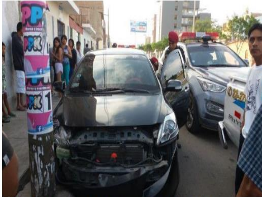
Así quedó el auto tras el accidente ocurrido en la calle Lora y Lora, en la ciudad de Chiclayo.

Compartir 0 Twitter G+1 0 in Compartir 0 Print 0 3