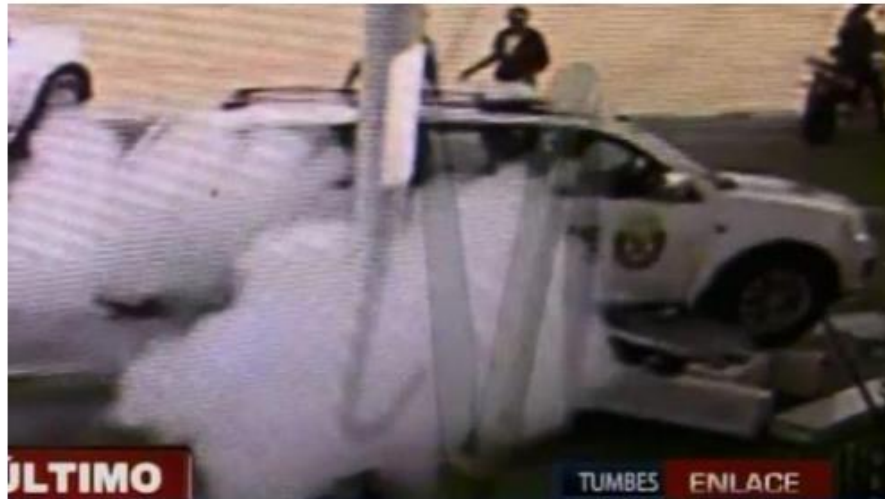
La fuga de gas en grifo de Tumbes causó alarma entre conductores y transeúntes.