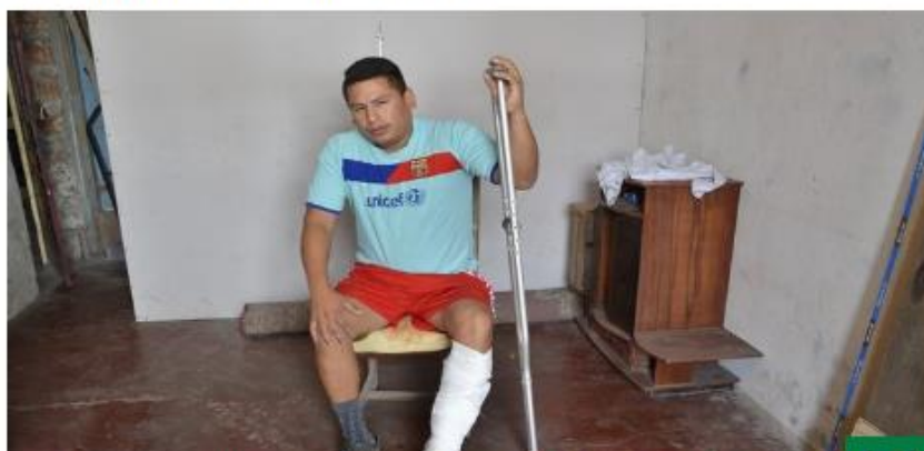
Villa El Salvador: Policía borracho balea a taxista en confuso incidente