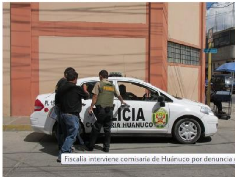
Fiscalía interviene comisaría de Huánuco por denuncia de 'coima'

Policía habría solicitado 500 soles al padre de un detenido para ayudarlo en la investigación preliminar.