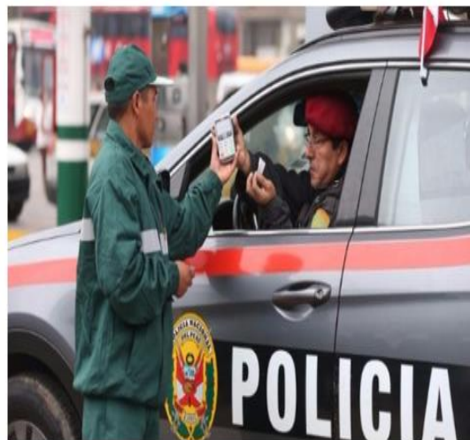
Acusan a personal de la SUAT de robar combustible

Un minucioso trabajo de inteligencia y acciones coordinadas desde la Inspectoría General del Sector Interior con la Inspectoría General de la Policía Nacional y la Policía Anticorrupción pusieron al descubierto el robo de combustible por parte de malos efectivos de la Subunidad de Acciones Tácticas de la Policía Nacional (SUAT).