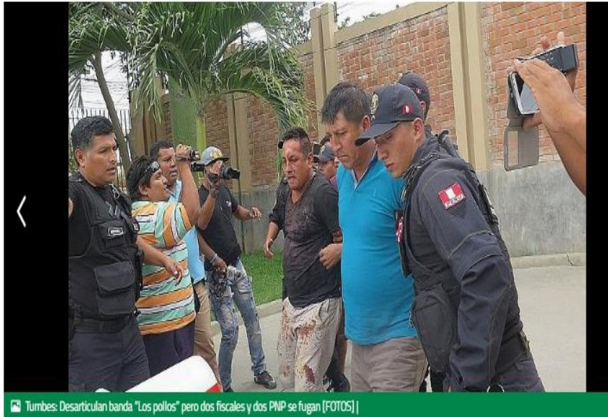
Tumbes: Desarticulan banda "Los pollos" pero dos fiscales y dos PNP se fugan [FOTOS]